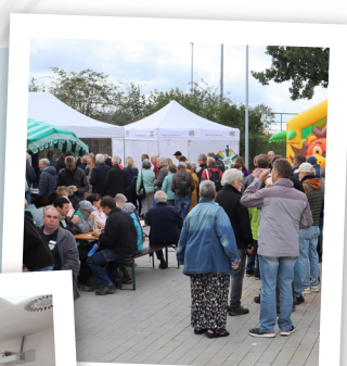
Ein toller Sonntag

Mehr Bilder vom Jubiläum unter www.facebook.com/Remstalwerk/