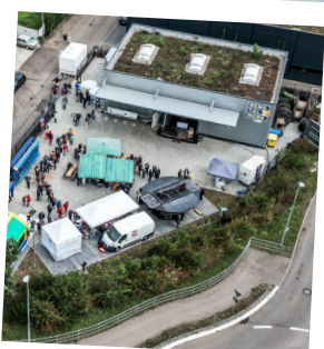
Ein gut besuchter Betriebshof

Unsere Jubiläumsfeier zum 10-Jährigen mit gleichzeitigem Tag der offenen Tür war ein voller Erfolg! Wir bedanken uns bei allen, die vorbeigeschaut haben. Wir haben uns riesig über den großen Andrang gefreut! Hier sehen Sie einige Impressionen von der Veranstaltung.