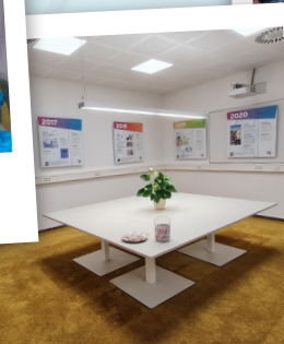
Ausstellung '10 Jahre' in der Geschäftsstelle