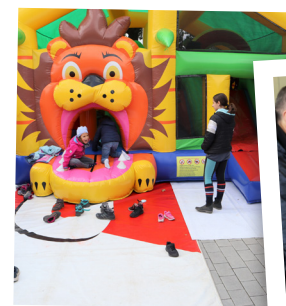
Spaß für Kids